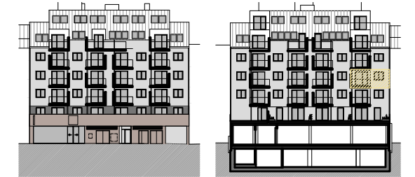
SÜDEN ANSICHT STRASSE NORDEN ANSICHT GARTEN